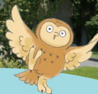
石正美術館 マスコットキャラクター くーちゃん