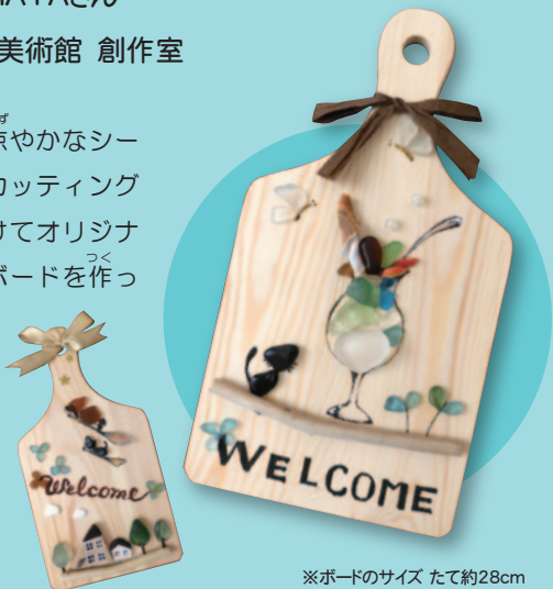
※ボードのサイズ たて約28cm

夏にぴったり、涼やかなシーグラスを木製のカッティングボードに貼り付けてオリジナルのウェルカムボードを作ってみませんか? ご家族での合作もOKです!